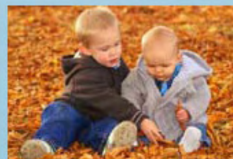
Nens jugant al terra d'un parc on podrien infectar-se Niños jugando en el suelo de un parque donde podrían infectarse

Els ous es difonen a través del reg sanguini fins que les larves s'allotgen als ronyons, al fetge o als pulmons de la persona infectada, formant quists en els quals creixen milers de paràsits.