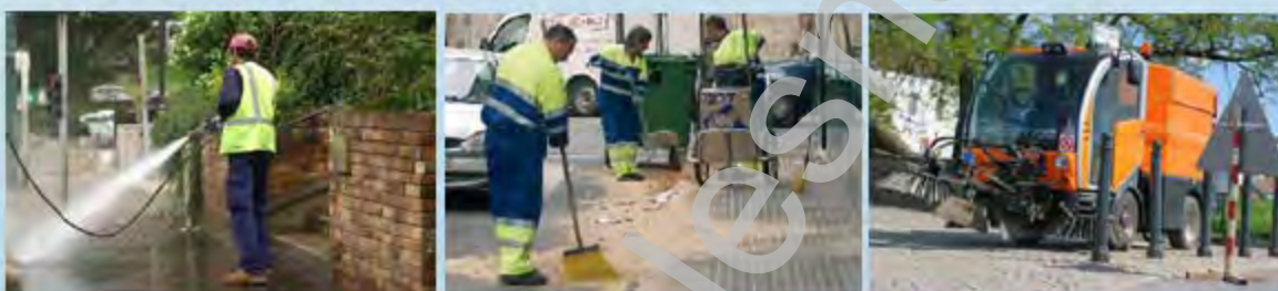
La neteja suposa un gran esforç econòmic pels ajuntaments La limpieza supone un gran esfuerzo económico a los ayuntamientos

Todos sabemos como estan de sucias nuestras calles y parques y muchas veces no por falta de limpieza ya que se vuelven a ensuciar rápidamente. Los ayuntamientos por las mañanas se esfuerzan a limpiar pero por la tarde ya vuelven a estar sucias.