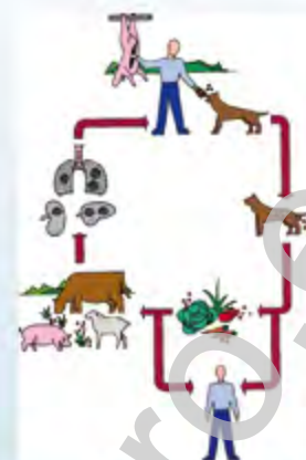
Cicle biològic malaltia Ciclo biológico enfermedad

Los huevos se difunden a través de la corriente sanguínea hasta que las larvas se alojan en los riñones, en el hígado o en los pulmones de la persona infectada, formando quistes en los que crecen miles de parásitos.