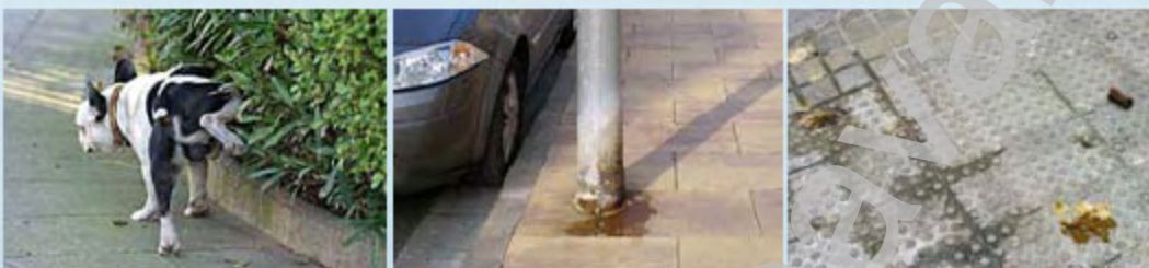
El problema el portem patint i pagant tots El problema lo llevamos sufriendo y pagando todos

Los perros si no van acompañados de sus amos hacen sus necesidades donde pueden y luego naturalmente nos lo encontramos por las calles.